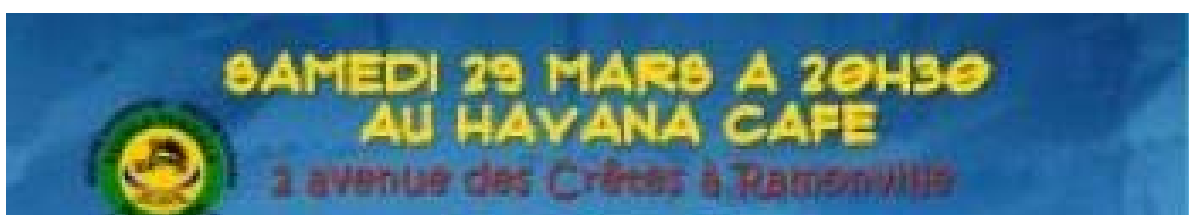
RAMONVILLE: SOIRÉE AFRO-BRÉSILIENNE AU HAVANA