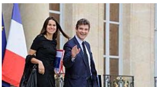
Aurélie Filippetti et Arnaud Montebourg vont avoir un bébé