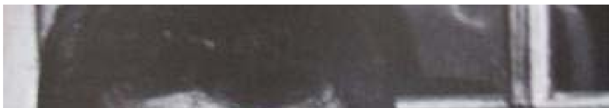
MONTRABE. RENDEZ-VOUS DE LA ROTONDE : AUTOUR DE REGGIANI